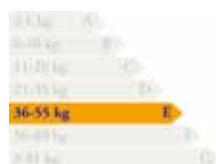
Classe émission de gaz à effet de serre